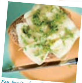
Een bruine boterham met kaas bij extra trek