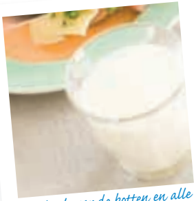
Speciaal voor de botten en alle toekomstige tandjes van de baby

Zwangere vrouwen hebben dagelijks 1000 milligram calcium nodig. Calcium zorgt voor de opbouw van de botten van de baby. Calcium zit in melk en melkproducten zoals yoghurt, vla, kwark en kaas. Zuivel levert 70 procent van de aanbevolen hoeveelheid calcium. In het overzicht van de aanbevolen dagelijkse hoeveelheden zie je precies hoeveel je nodig hebt.